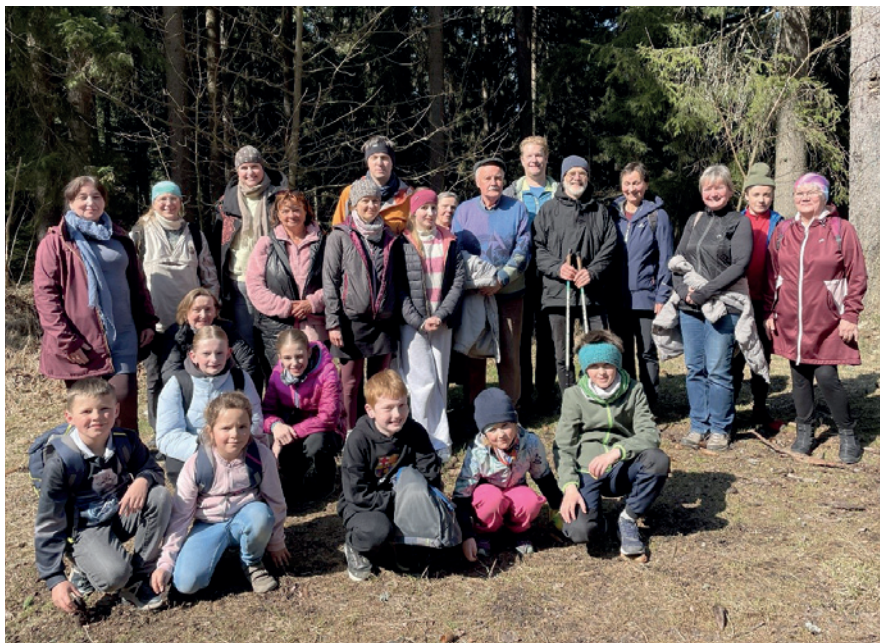
Odpolední výlet po okolí Herlíkovic