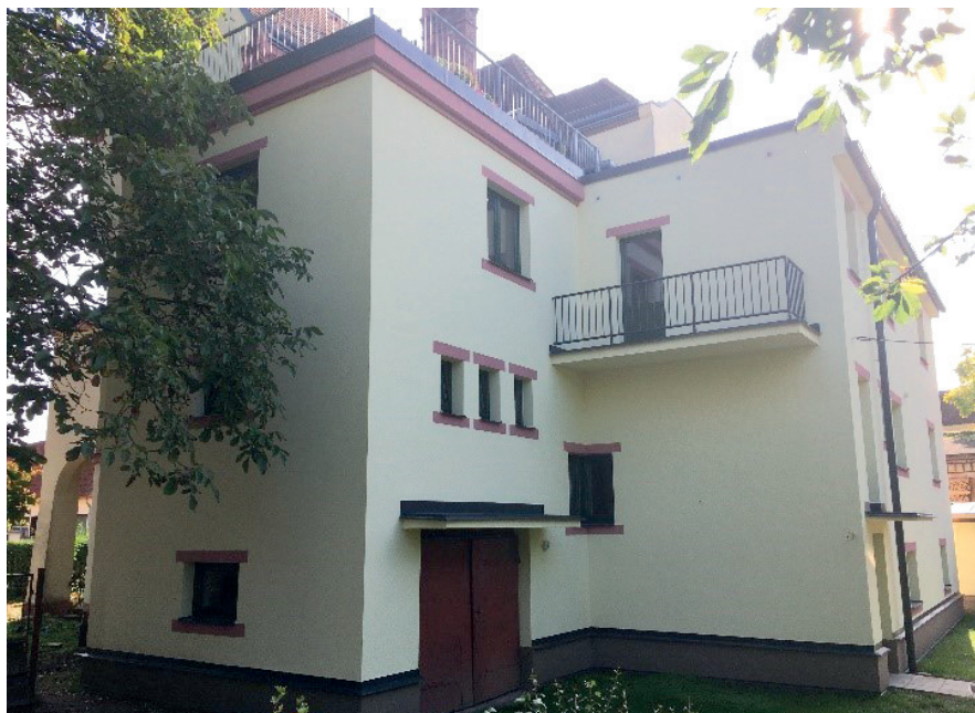
...a fara po opravách