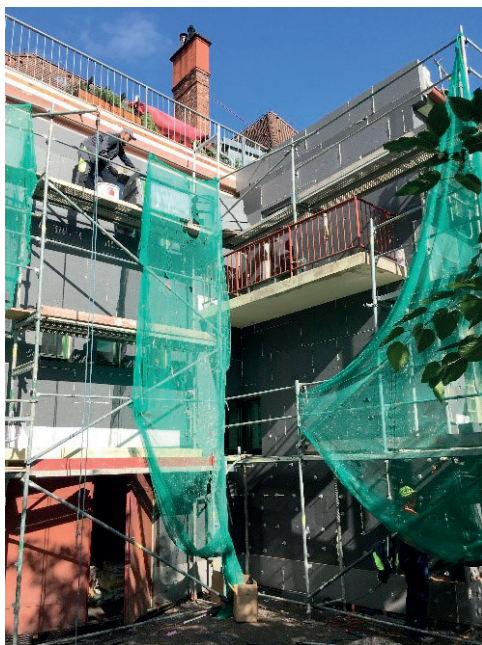
Opravy fary Vrchlabí...

Poslední krok máme letos čerstvě za sebou. V létě jsme vyměnili okna ve farářském bytě. Byla to větší výzva než u přístavby, protože nám velmi záleželo na tom, abychom zachovali původní podobu fary. Němečtí architekti ji před sto lety moudře a krásně vymysleli a stavitelé postavili. Máme za co být vděční našim předchůdcům z německého sboru, který faru postavil. Už při první výměně oken se nám velmi osvědčilo duo tchána a zetě, evangelických truhlářů