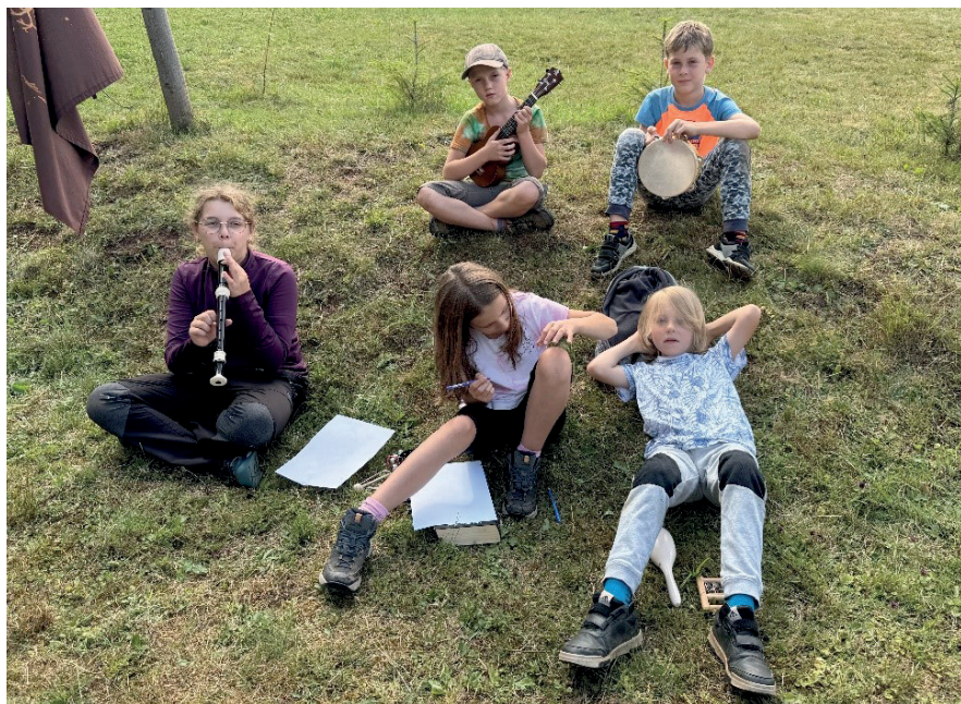
Tábor dětí na Pecce na louce