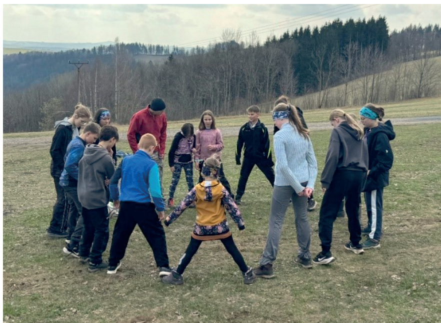
Víkendovka dětí v Křížlicích