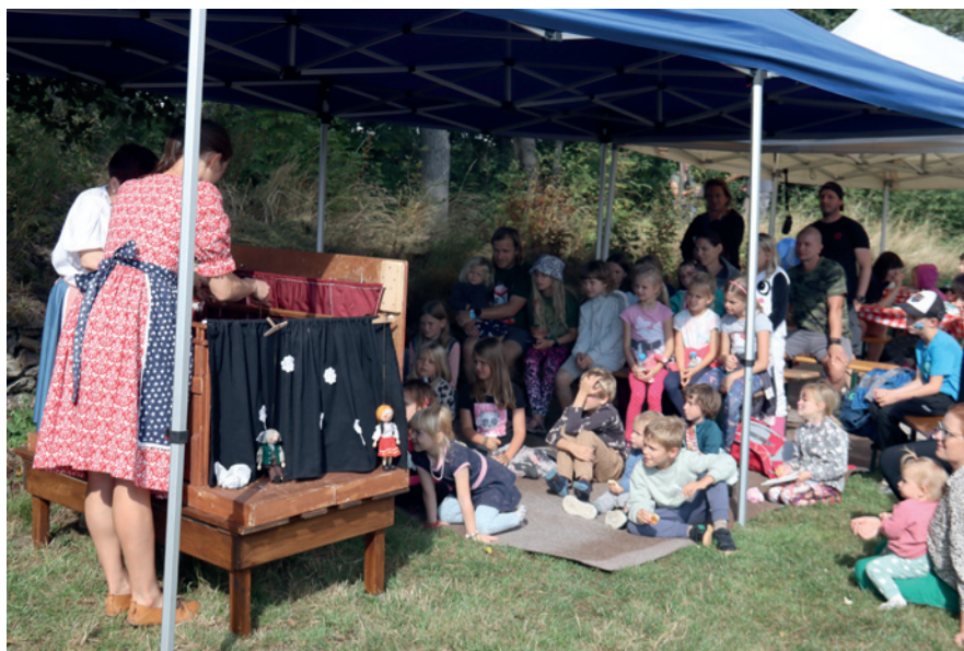
Křížlické podletí divadlo pro děti