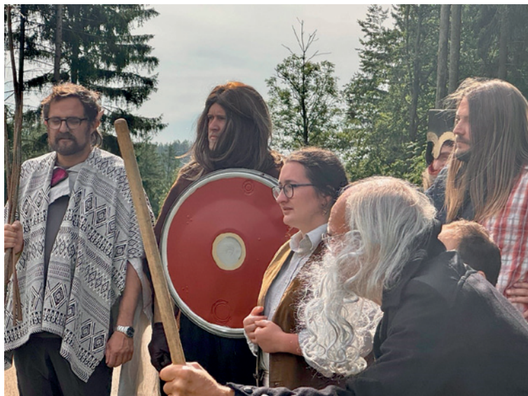
Tábor dětí na Pecce

Už před dvěma lety jsme se začali věnovat příběhům o hobitech a jejich dobrodružstvích podle knih J. R. R. Tolkiena. Poprvé to bylo podle knihy Hobit, Cesta tam a zase zpátky . Poslední léto nás celý tábor provázel příběh prvního dílu Pána prstenů Společenstvo prstenů. Hobiti, elfové, trpaslíci, lidé i čaroděj Gandalf nás na táboře pravidelně navštěvovali. Letos v termínu 19. – 26. 7. se tábor ponese v duchu druhého dílu Dvě věže . Srdečně zveme všechny děti ve věku 7–13 let. (Přihlaďte se zde: https://bit.ly/LT Pecka )