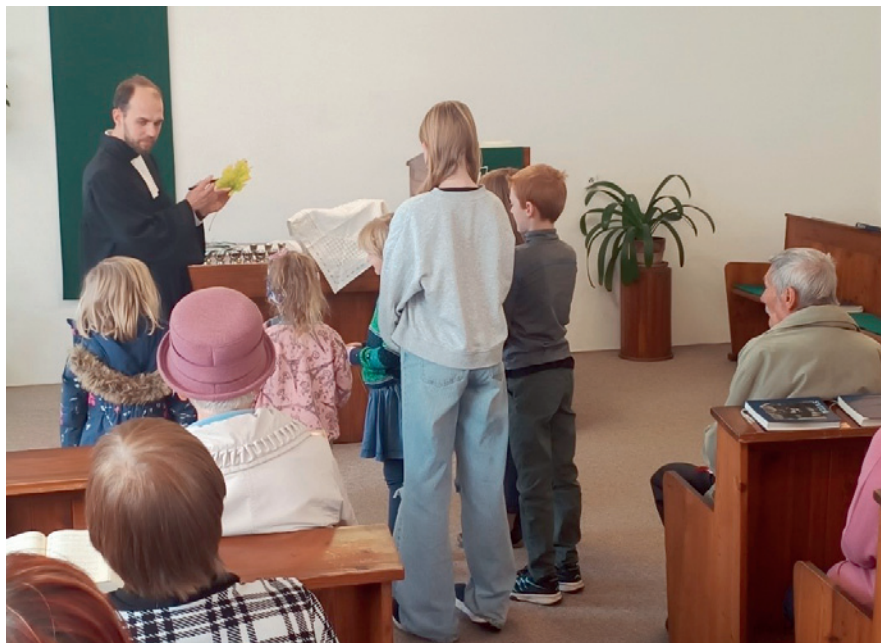
Vyslání dětí do nedělní školy při společných bohoslužbách

Většina účastníků přijala po bohoslužbách pozvání k menšímu občerstvení a neformálním rozhovorům u kávy a čaje. Jsme moc rádi, že jsme mohli být hostiteli bratří a sester z okolních sborů a těšíme se za rok na shledanou v Libštátě.