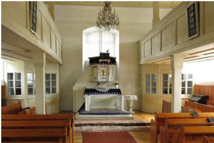
Interiér kostela v Křížlicích

Sbor prošel v minulosti různými společenskými a politickými změnami, a asi úspěšně, protože nezanikl. Do budoucna bude zřejmě nutné spojení s okolními sbory, ale to jistě bude k prospěchu všem. Bude to zase společné dílo většího počtu bratří a sester.