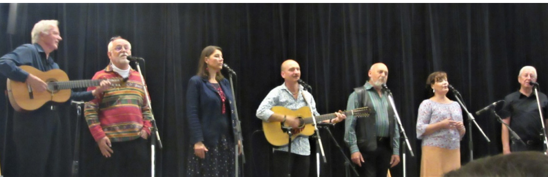
Koncert Spirituál kvintetu v roce 2018 v Libštátě